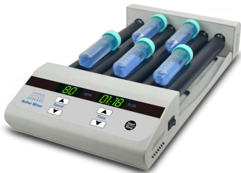
LM-80T / LM-80S