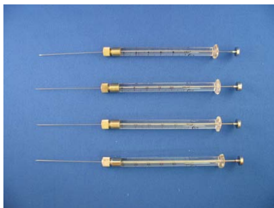
可換尖針型微量注射針 Removable Needle Syringes