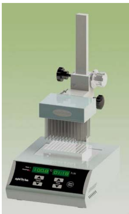
SC-9600 吹氮濃縮加熱裝置