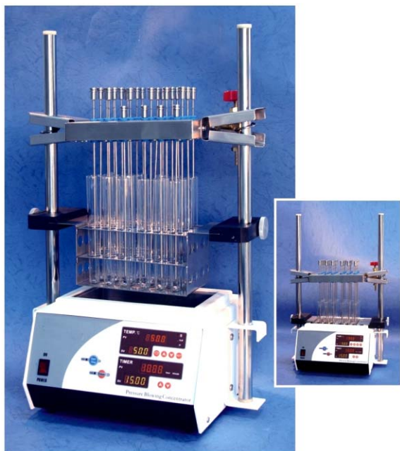
SC-2800W/ SC-2800D 吹氮濃縮加熱裝置